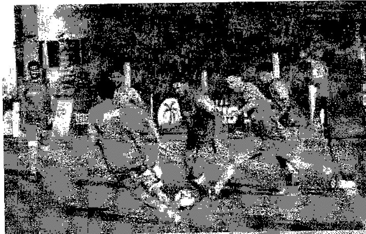
Equipe do Sampaio intensificou preparação em treino no CT