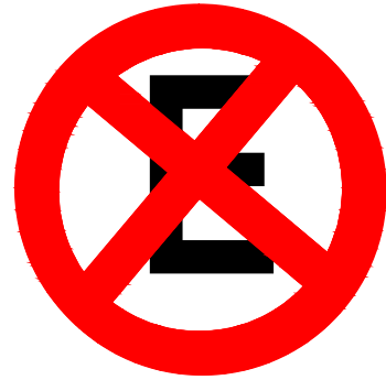
Proibido Parar e Estacionnar