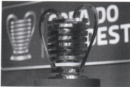
Tricolor conheceu adversários na Copa do Nordeste 2021

O Sampaio Corrêa conheceu seus adversários na Copa do Nordeste 2021, após sorteio realizado na sede da Confederação Brasileira de Futebol (CBF), no Rio de Janeiro, na manhã desta quinta-feira, 4.