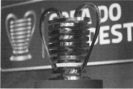
Tricolor conheceu adversários na Copa do Nordeste 2021

O Sampaio Corrêa conheceu seus adversários na Copa do Nordeste 2021, após sorteio realizado na sede da Confederação Brasileira de Futebol (CBF), no Rio de Janeiro, na manhã desta quinta-feira, 4.